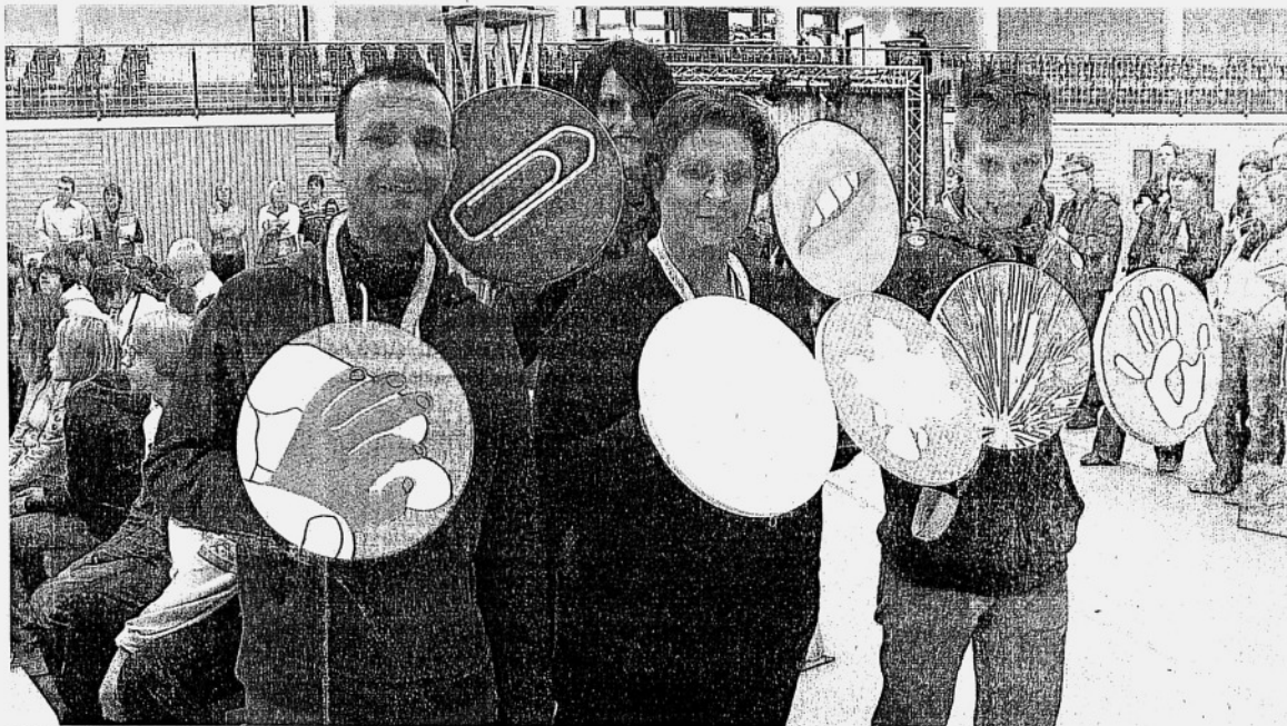
Sieben Neigungspunkte waren zu vergeben, unter anderem zu den Themen Ordnung, Redegewandtheit, Kreativität, zu mathematischem Grundverständnis, zum „grünen Daumen“ und rund um den Komplex „Helfen“.

Dazu gehören die Entwicklung eines gesunden Selbstbewusstseins und das Vertrauen in die eigenen Stärken. Diese zu kennen, hilft weiter: im Alltag, in Beziehungen und natürlich vor allem, wenn die Berufswahl