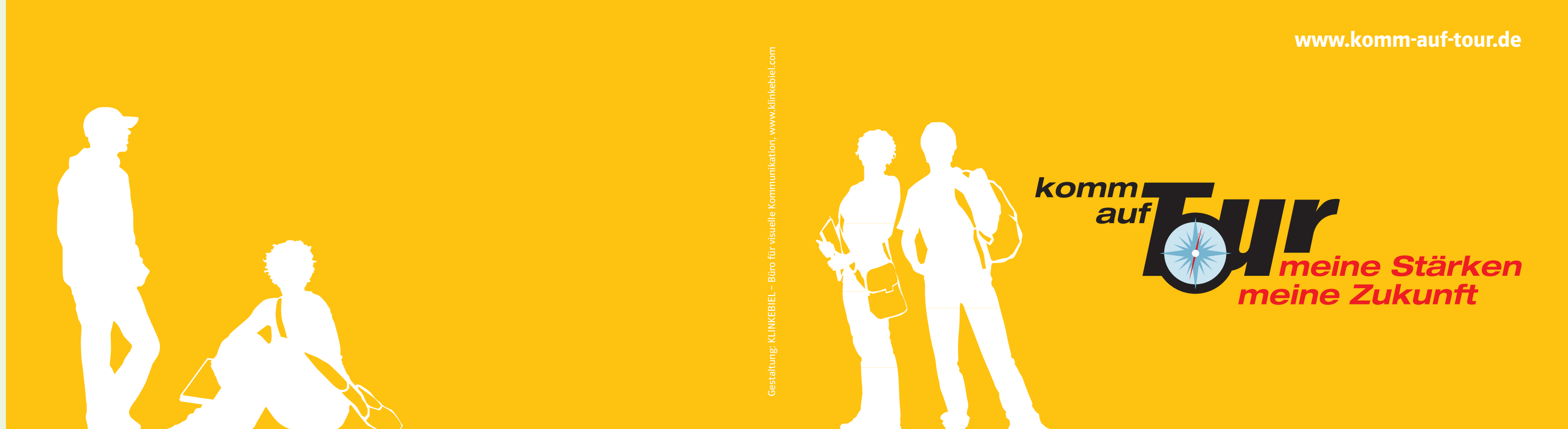
Gestaltung: KLINKEBIEL – Büro für visuelle Kommunikation, www.klinkebiel.com